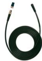
Sensor de Temperatura RTD con cable de extensión de 7 pies Catalogo #2129.96