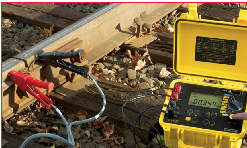
Verificación de uniones de rieles con el Modelo 6250

El Micro-Ohmmetro de 10A Modelo 6250 es un probador robusto, de baja resistencia diseñado para trabajo de mantención en planta, control de calidad en manufacturas y uso en terreno. El Modelo 6250 es uno de los Micro-Ohmmetros existentes más exactos, con una exactitud de 0.05%, al utilizar un método de prueba Kelvin de cuatro-cables.