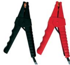
Pinzas Kelvin, un par, (10A) 10 pies Catalogo #1017.84