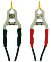
Pinzas Kelvin, un par, (1A) 10 pies Catalogo #1017.83