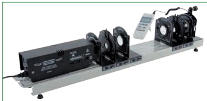
Experiment for Malus' Law / Experimento para Ley de Malus