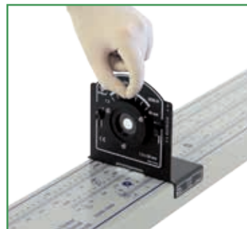
Iris adjustment / Ajuste del iris