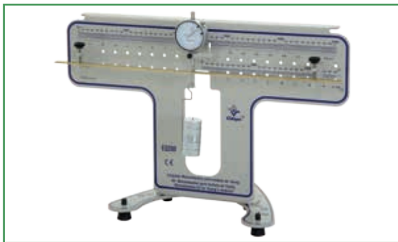
Bar supported by the ends / Barra apoyada por las extremidades