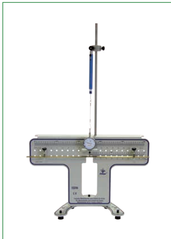
Calibration of the dial indicator / Calibración del reloj comparador