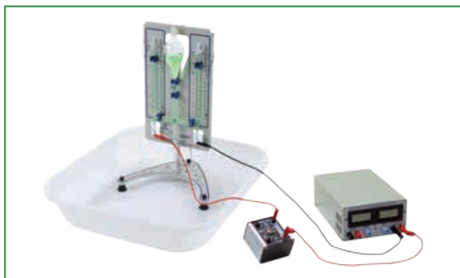
Electrolysis of water / Electrólisis del agua