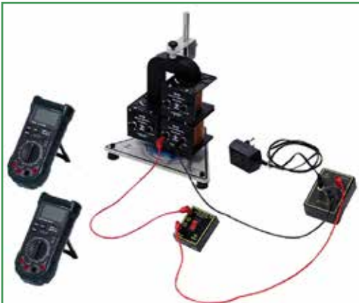
Magnetic field generated by the transformer armature / Campo magnético generado por la armadura del transformador