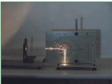
Geometrical Optics - Total Reflection in a prism (EQ045B, EQ045G, EQ262B, EQ817) / Óptica geométrica: reflexión total en un prisma (EQ045B, EQ045G, EQ262B, EQ817)