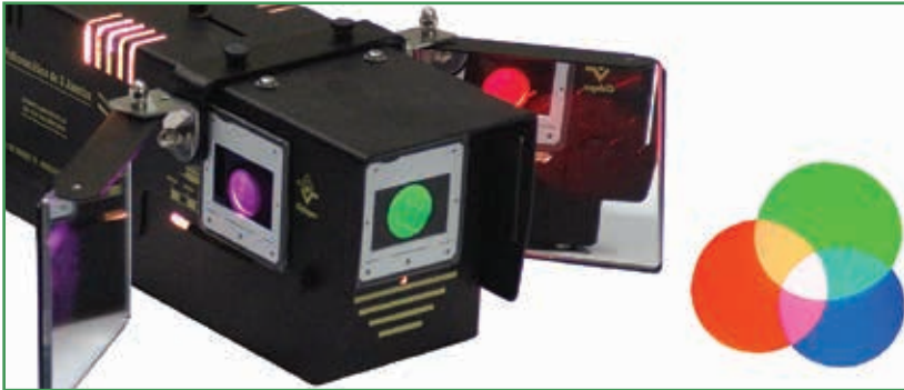
Composition of colors by light superposition (EQ045G) / Composición de los colores por superposición luminosa (EQ045G)